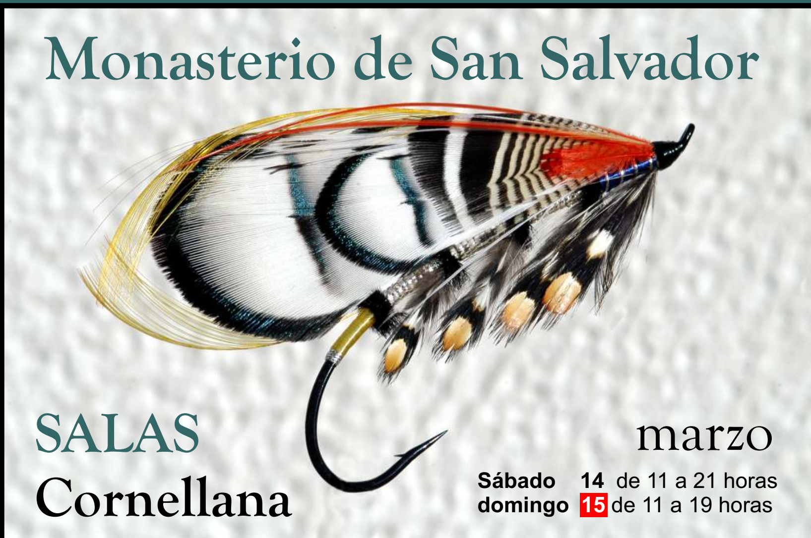
Evening Star por José Pedro Vigil Martín. Olloniego - Asturias.

Se rematará “exclusivamente” el Campanu de Asturias. Si se pesca por la mañana, la subasta se realizará pasada la hora sexta (a las 13 horas) y si se pesca después, se rematará tras las vísperas (a las 18,30). Más allá de este horario, cualquier tipo de transacción quedará a la libre disposición de las partes. “Que buena pro les haga”.