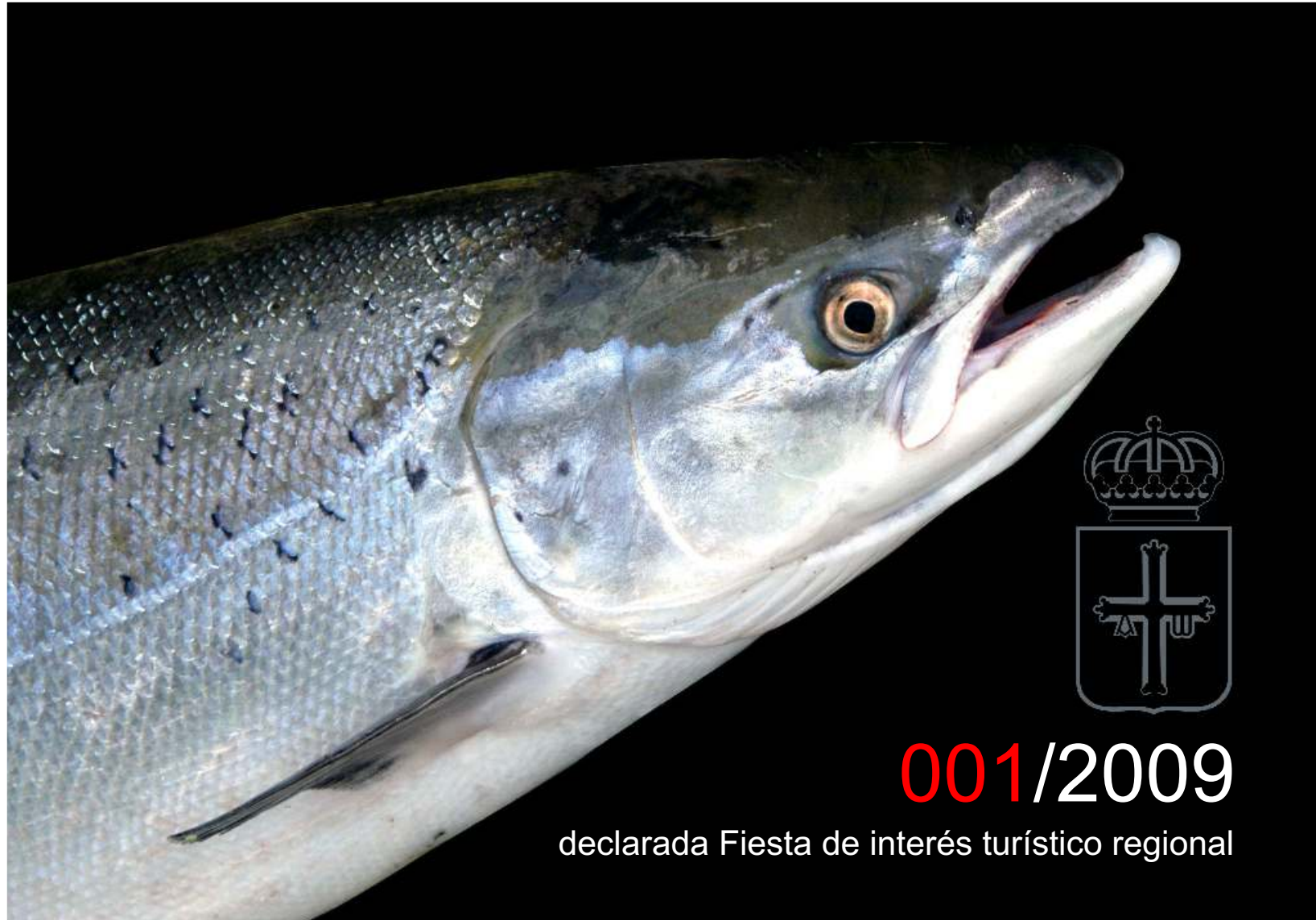
Salmón de 6,5 Kg, capturado a cebo natural por Pepe el de Quinzanas en el puente del mismo nombre.